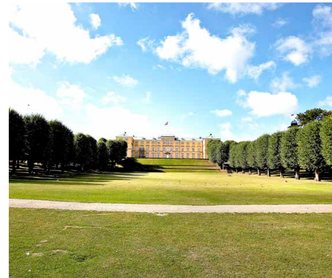
Kommunens økonomiske vækst og velstand er ikke kommet af sig selv