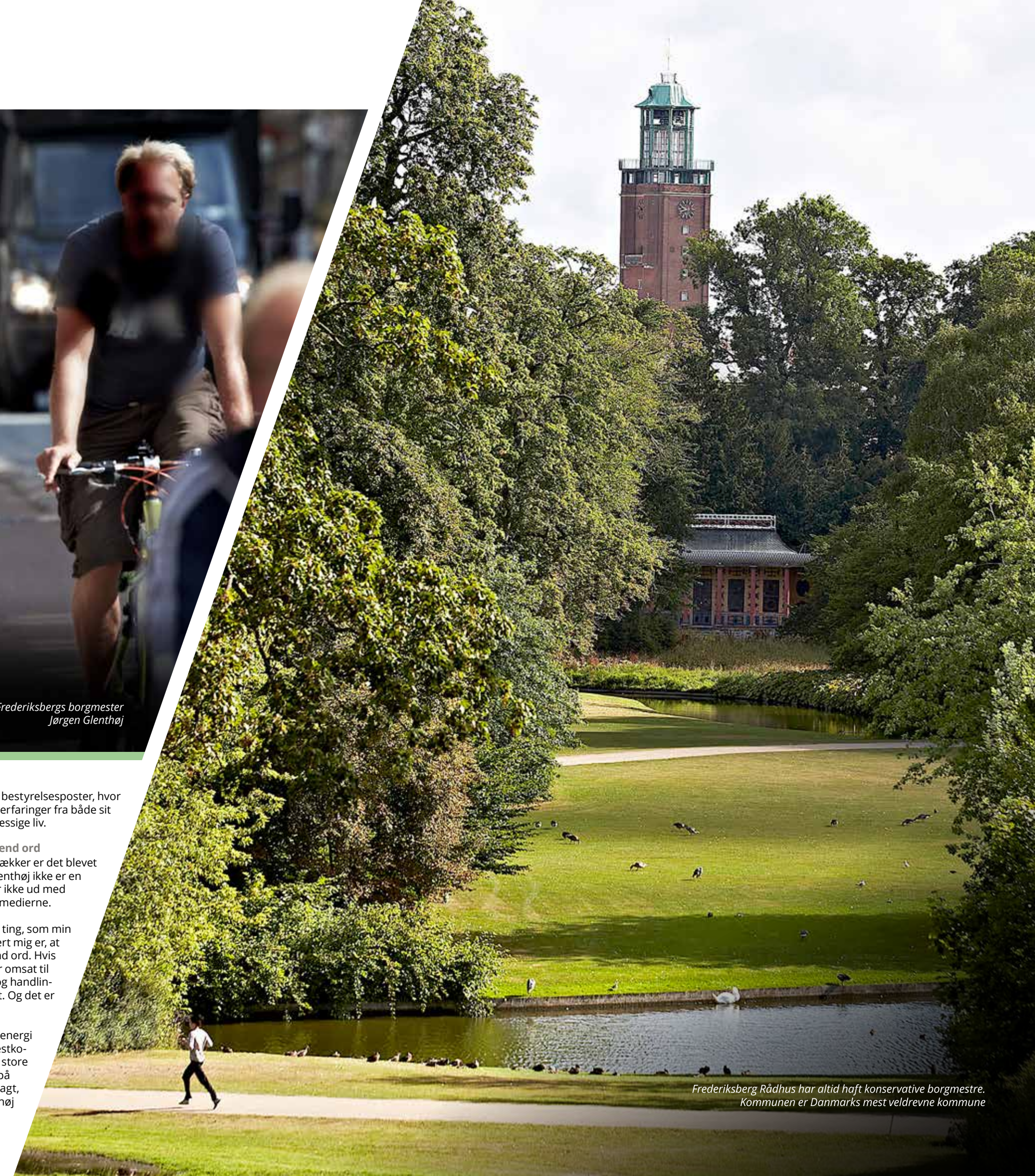
Frederiksberg Rådhus har altid haft konservative borgmestre. Kommunen er Danmarks mest veldrevne kommune